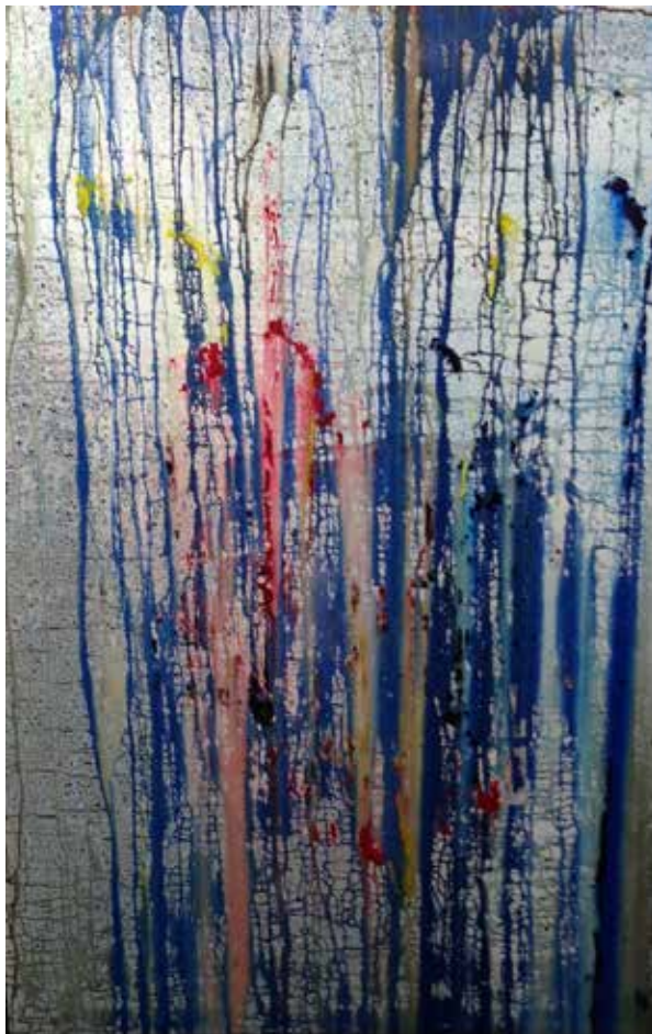
10. Série Towns, 2013/14 Acrílico s/ tela, 120x80 cm