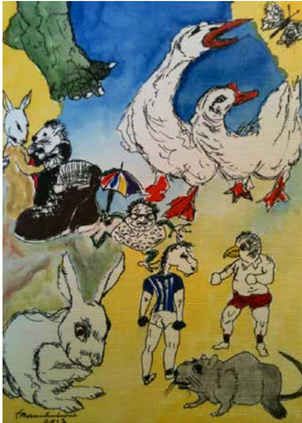
13. O coelho vais levar com a bota... , 2013 Técnica mista s/ papel, 70x50 cm