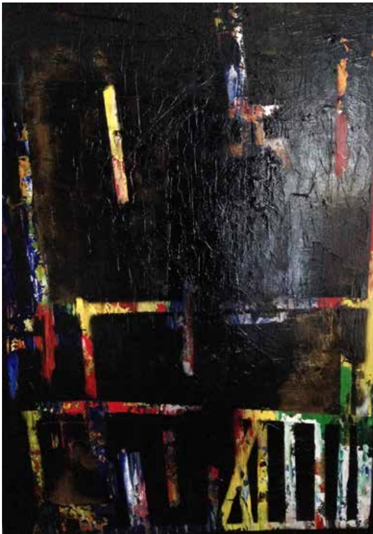
1. Série Towns, 2013 Acrílico s/ tela, 180x125 cm