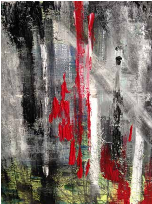
8. Série Towns, 2013 Acrílico s/ tela, 100x80 cm