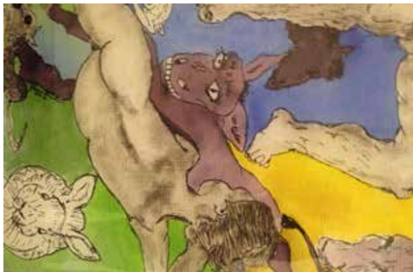
14. Foge coelho que ela vai cair..., 2013 Técnica mista s/ papel, 70x50 cm