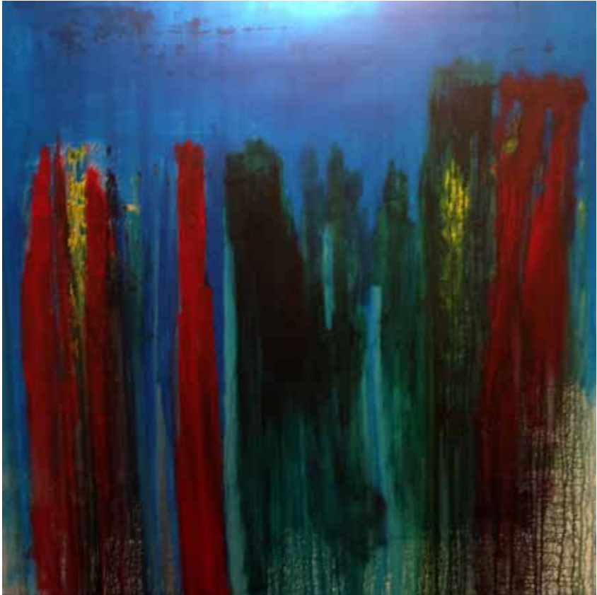
11. Série Towns, 2013/14 Acrílico s/ tela, 130x130 cm