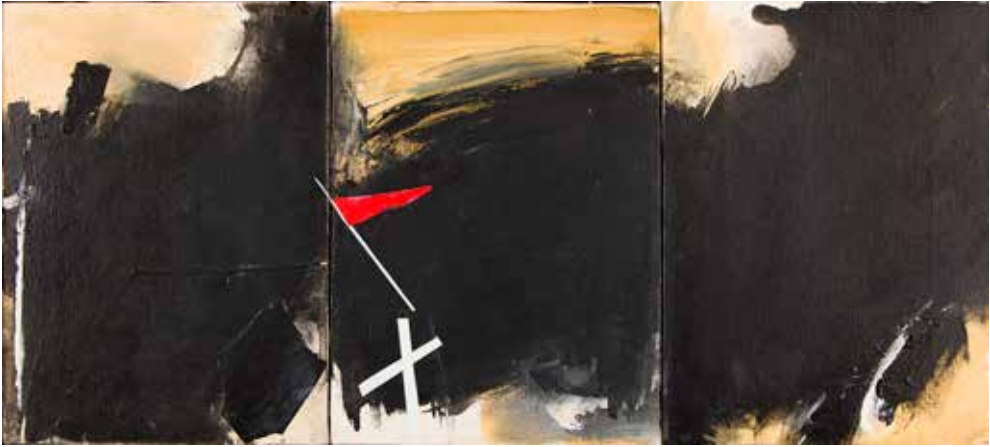
Sem título, (c.1996) - Maqueta Óleo e colagem sobre tela, 24,5x54,5 cm