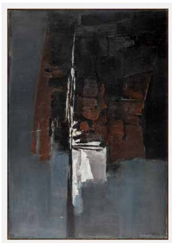
Sem título, 1960 Óleo sobre tela, 70x90 cm