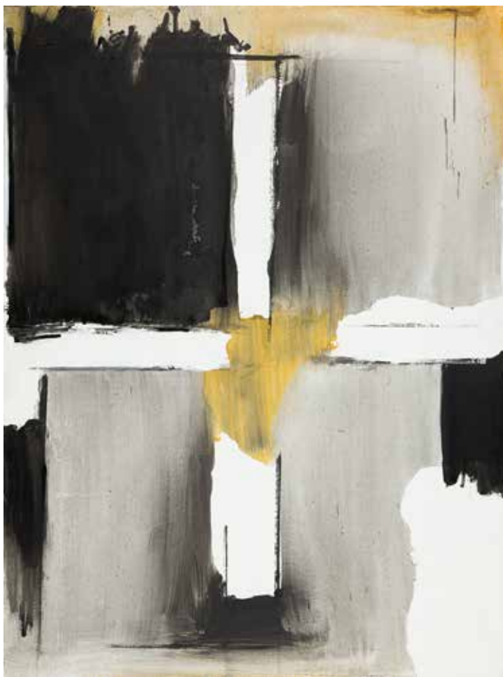
Dias de Chuva, 1998 Acrílico sobre tela, 130x97 cm