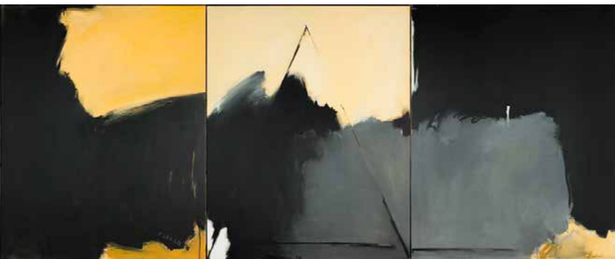
Personagem na Paisagem I, 1992 Acrílico sobre tela, 162x400 cm