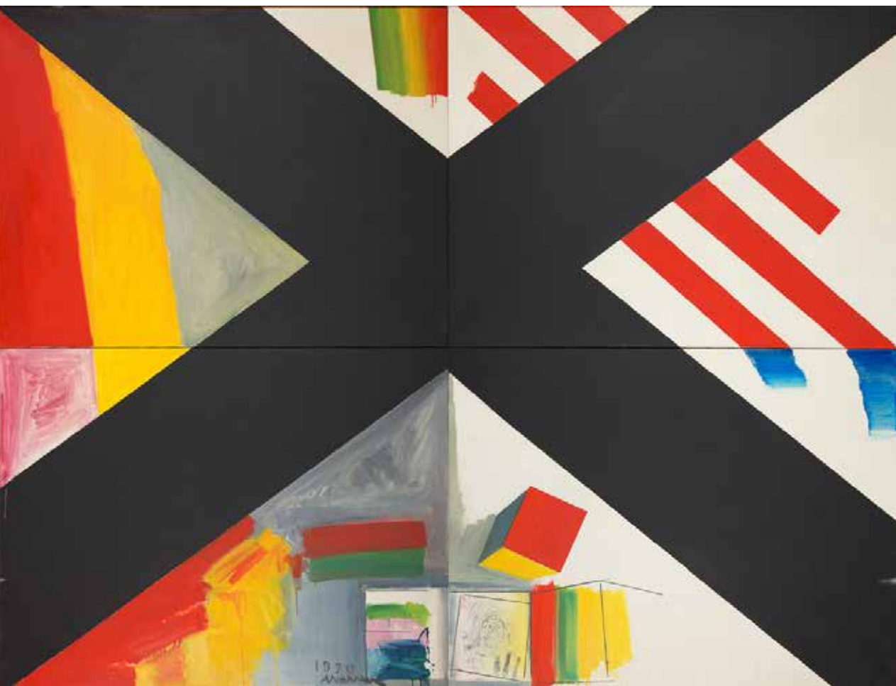
O Grande X, 1970 Óleo sobre tela, 194x260 cm