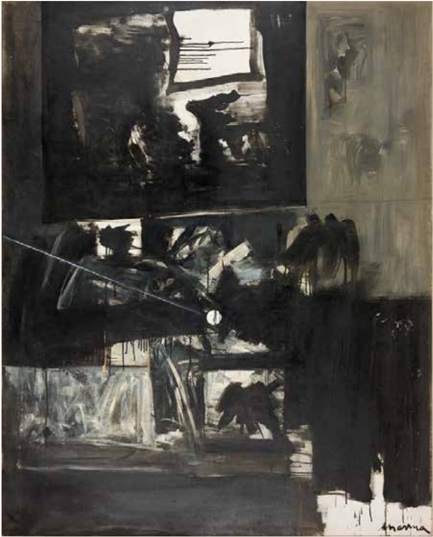
Mensagem II, n.d. Óleo sobre tela, 163x130,5 cm