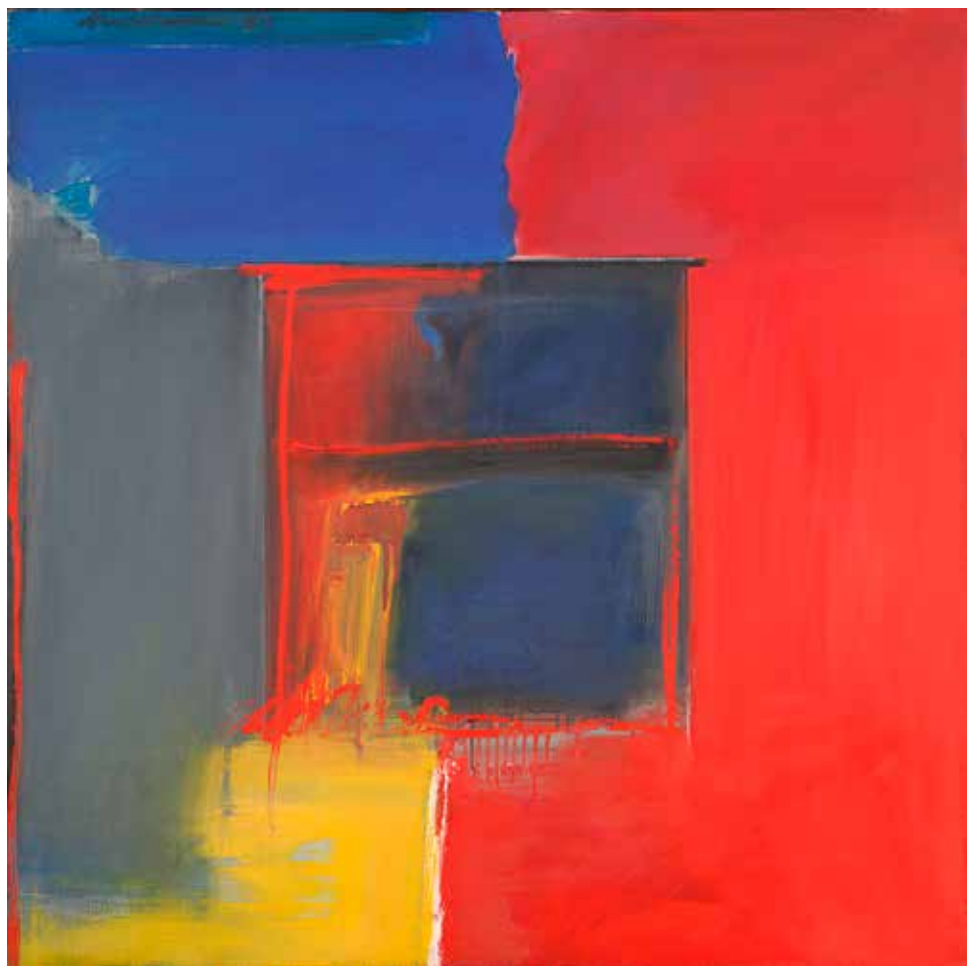
A Marca, 1987 Óleo sobre tela, 80x80 cm