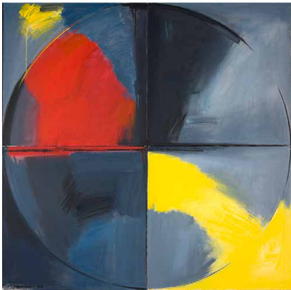
Circulo, 1987 Óleo sobre tela, 160x160cm