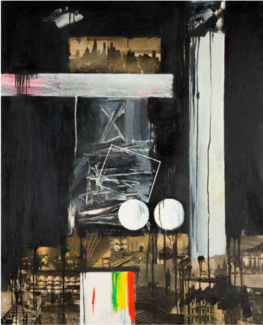
Sem título, n.d. [1965] Óleo e colagem sobre tela, 163x130,5 cm