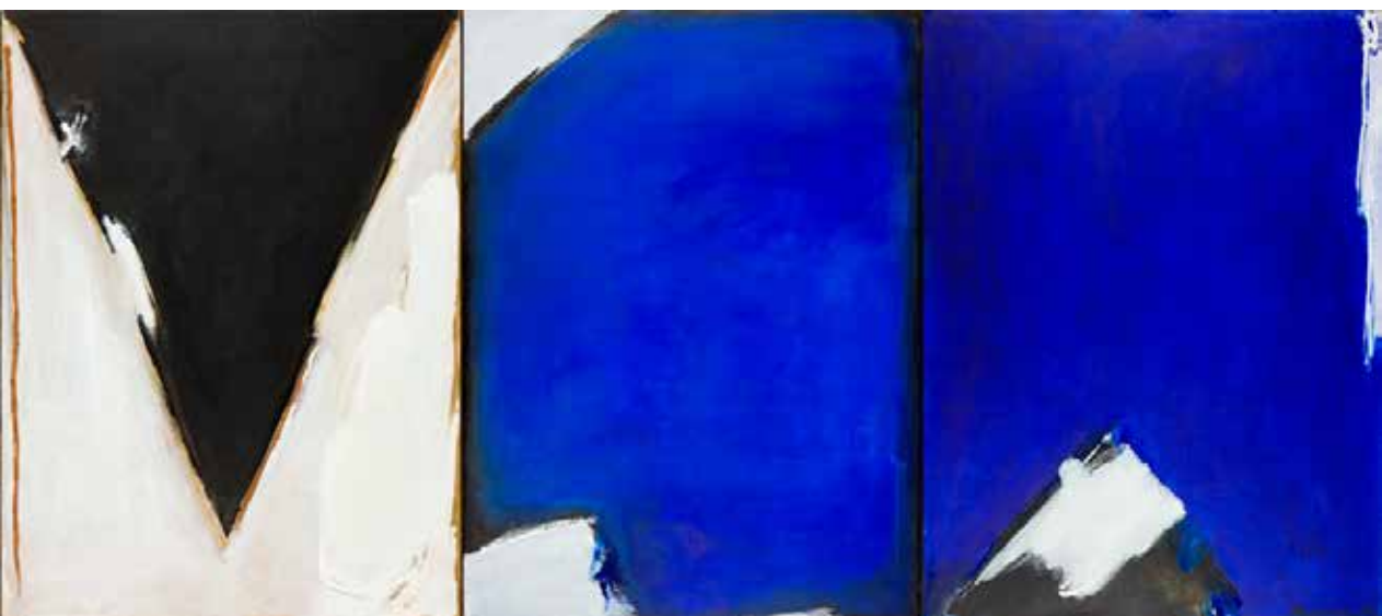
De Samarcanda ao Himalaia, 1992 Acrílico sobre tela, 130x300 cm