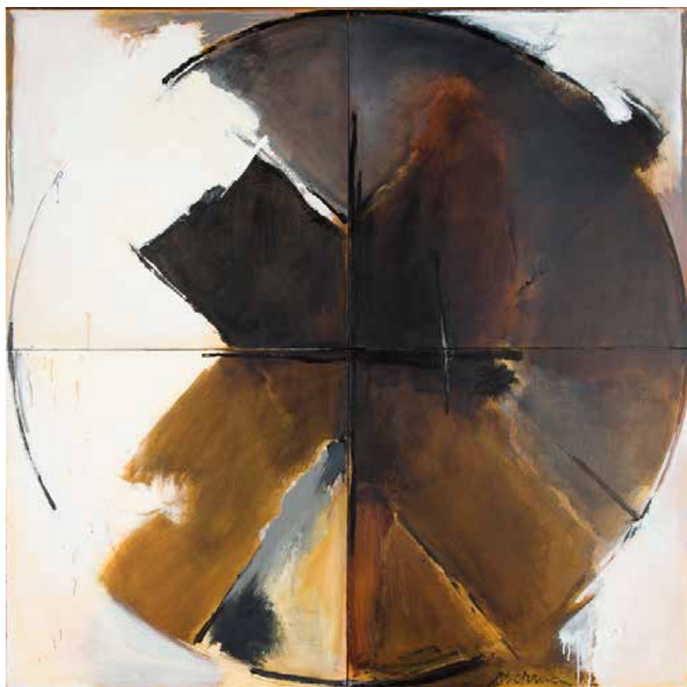
O Círculo, o X e a Cruz, 1992 Acrílico sobre tela, 160x160 cm