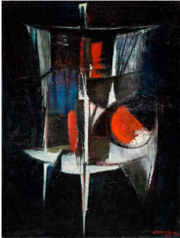
Sem título, 1959 Óleo sobre tela, 130x97,5 cm