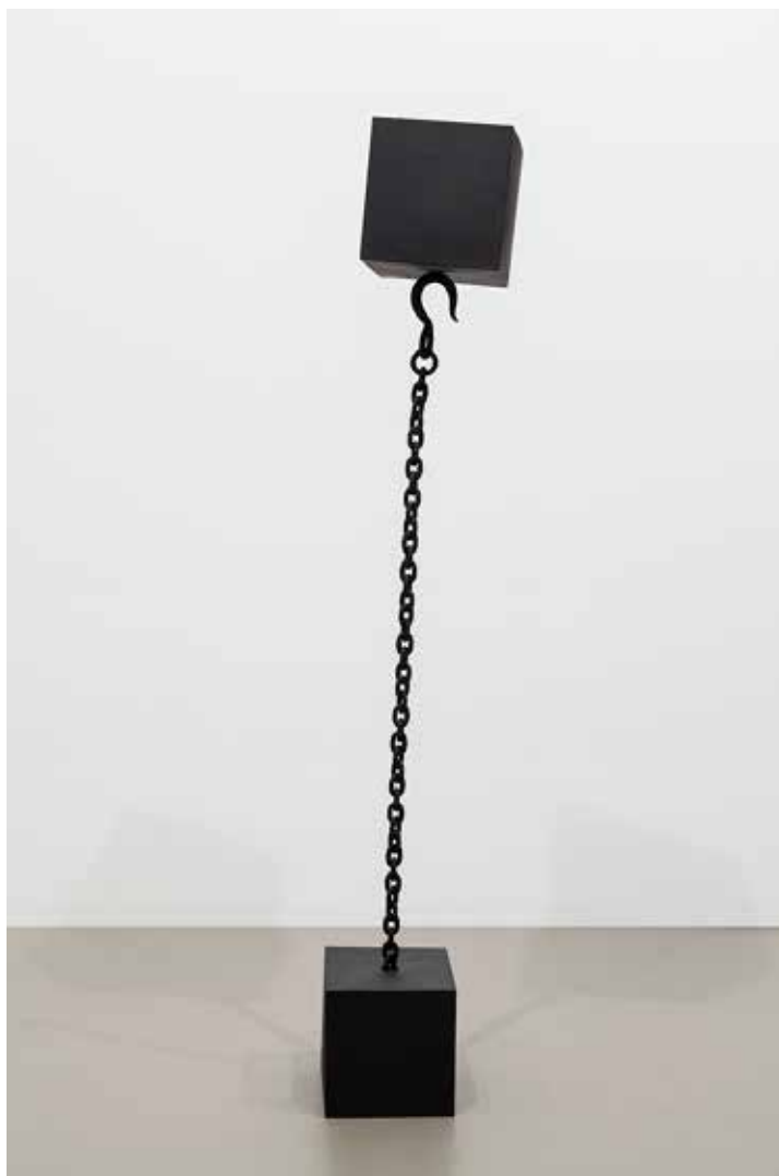
Apoiado versus Suspenso, 1969 Escultura em ferro, 180x25x25 cm