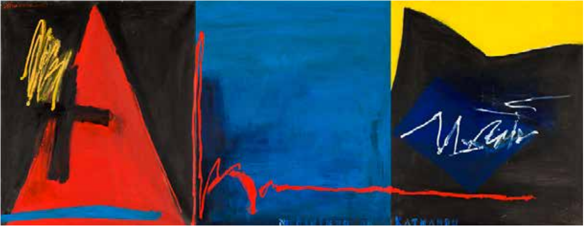
No Caminho de Katmandu, 2003 Óleo sobre tela, 80x240 cm