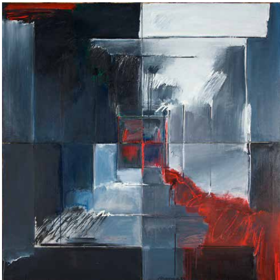
Labirinto, 1988 Óleo sobre tela, 160x160 cm