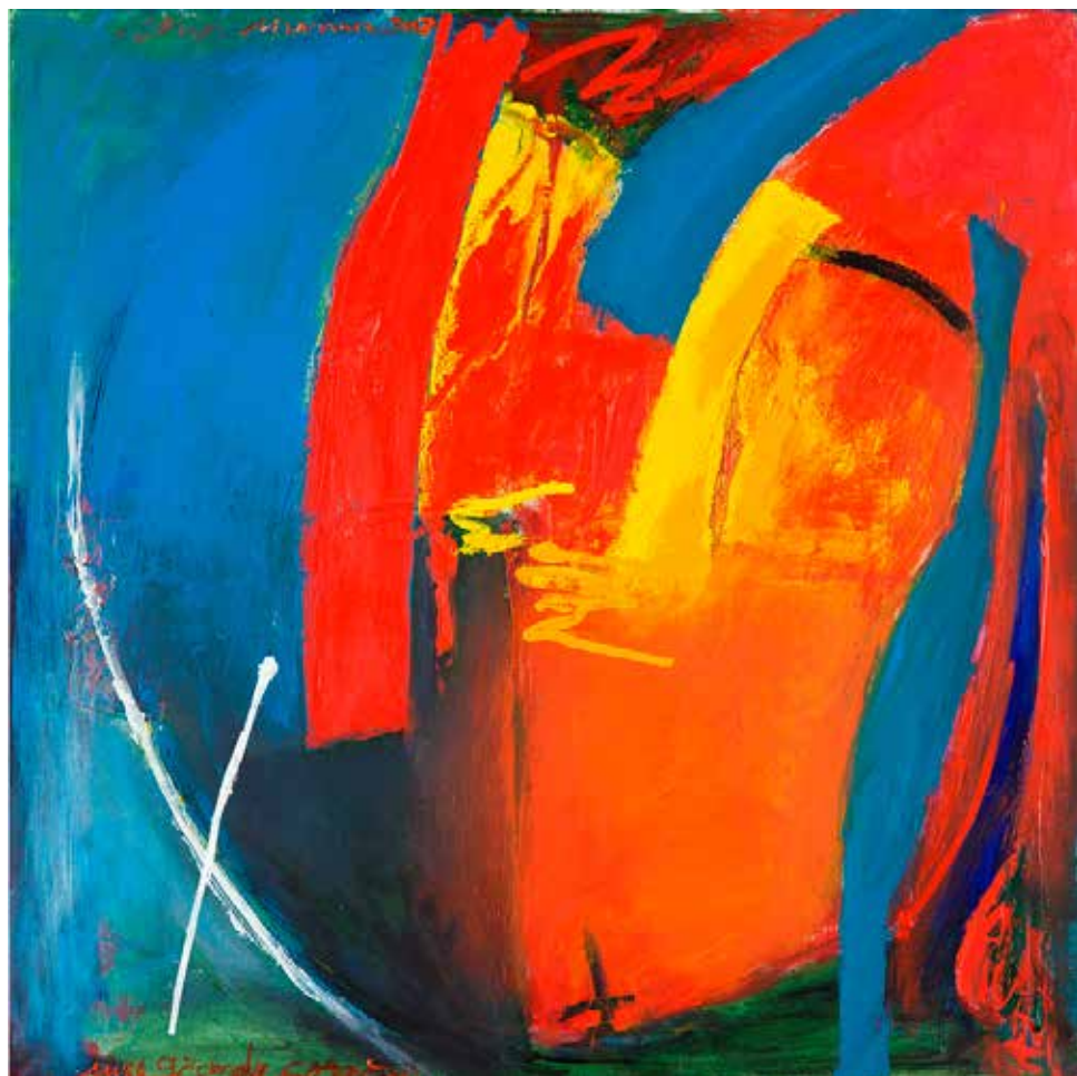
Um Grande Coração, 2003 Acrílico sobre tela, 80x80 cm