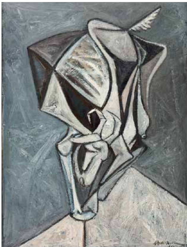
Sem título, 1966 Óleo sobre tela, 100x94 cm