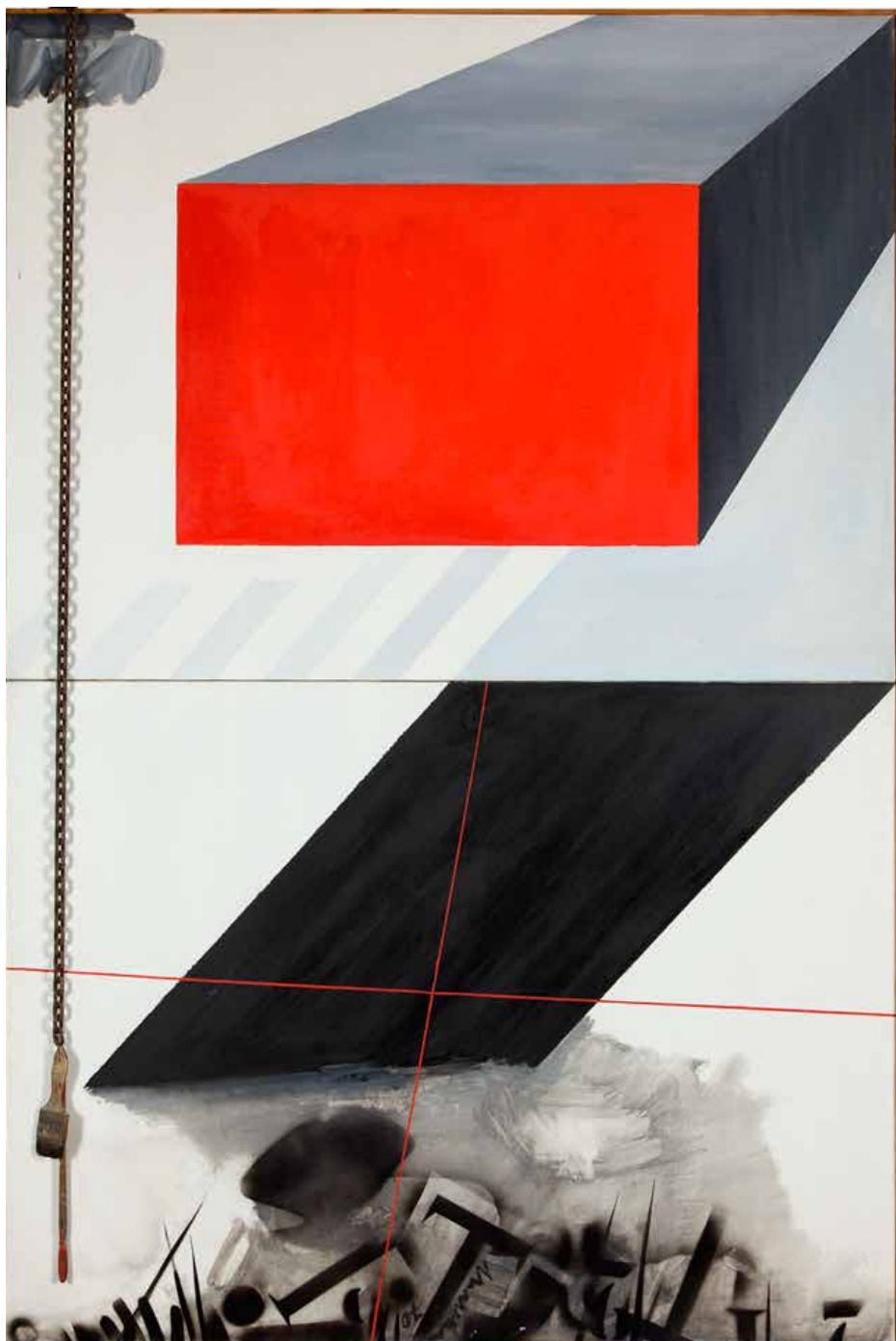
Mensagem II, n.d. Óleo sobre tela, 163x130,5 cm