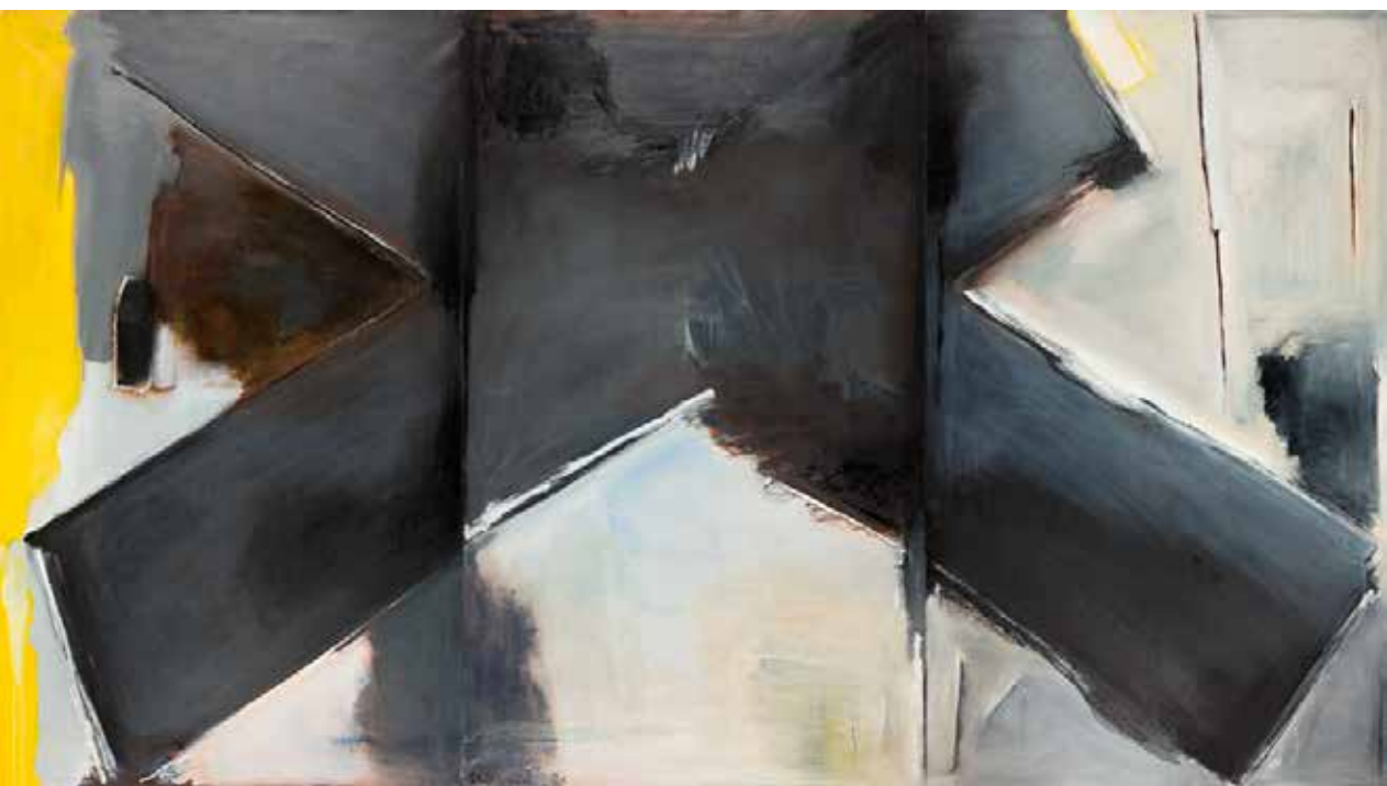
X em Castanhos, 1988 Óleo sobre tela, 162x300 cm