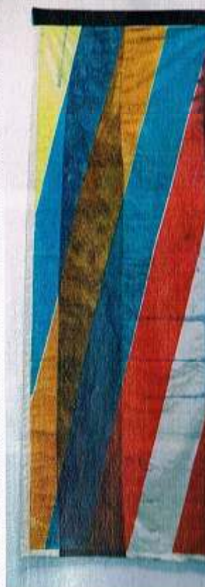
Título Surprise Surprise (F) Galeria Reflexus Morada I Técnica Acrílico sobre alg Dimensões 210x 180 cm