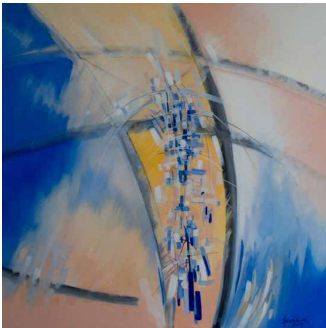
4. Movimento perpétuo II, 2015 Óleo e grafite s/ tela, 100x100 cm