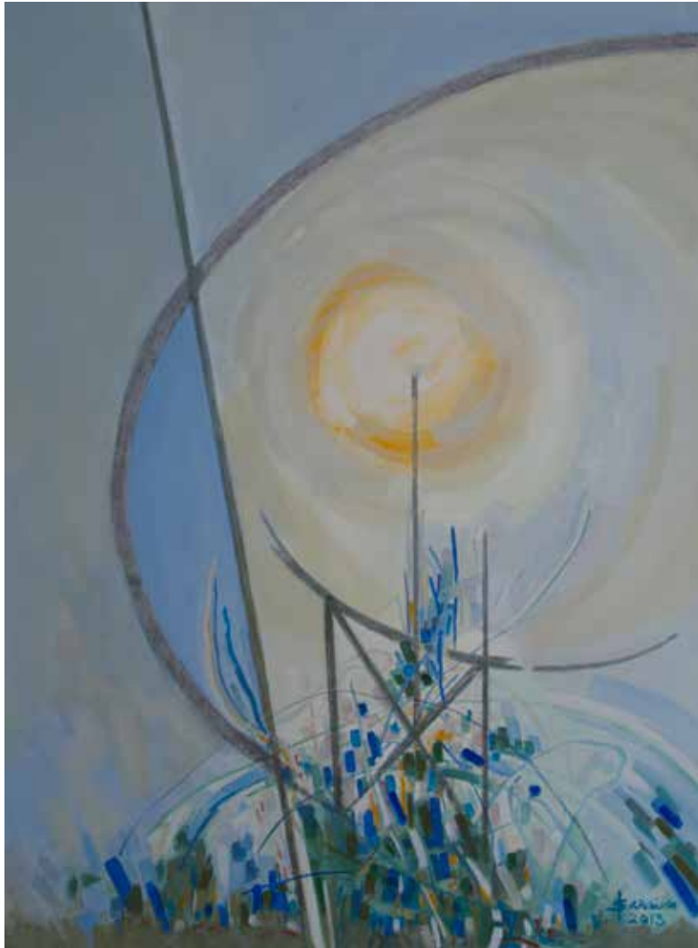
15. O Sol: aproveita-o e vê , 2013