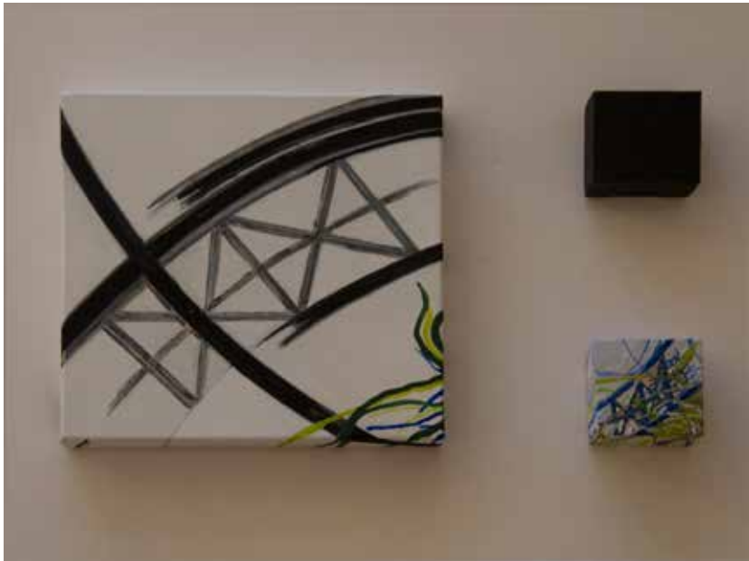
17. Composição I, 2015 Óleo s/ tela, 50x60 cm / cada