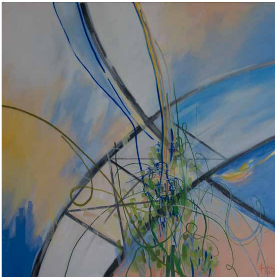
3. Movimento perpétuo I, 2015 Óleo e grafite s/ tela, 100x100 cm