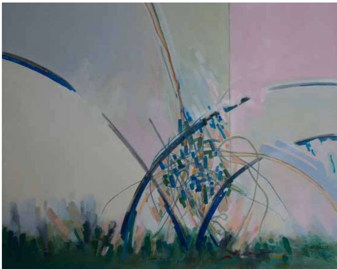
14. Surpresa: da água brotaram todas as coisas - brotaste, 2013 Óleo s/ tela, 100x80 cm