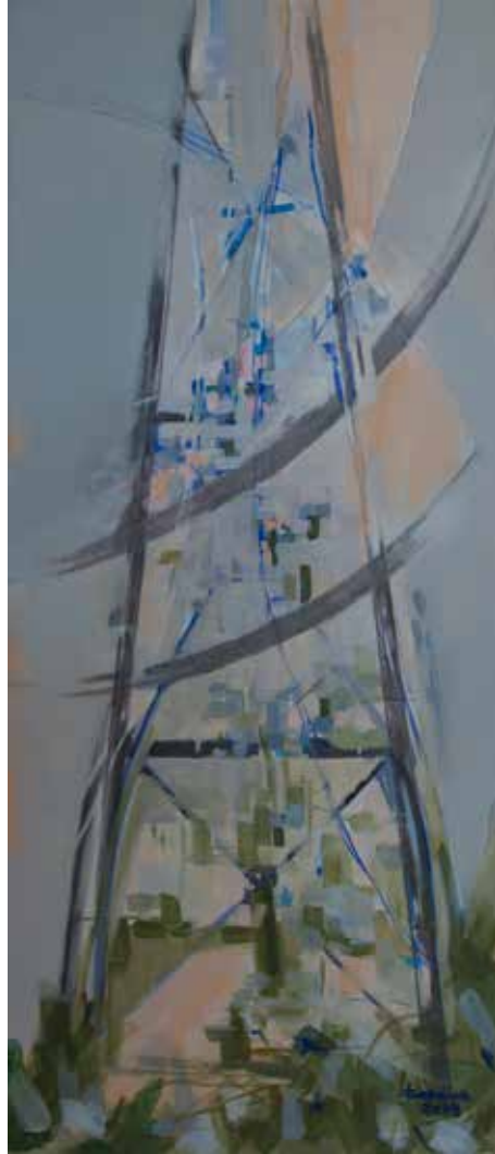
13. Pilar e arco da ponte Luiz I, 2012