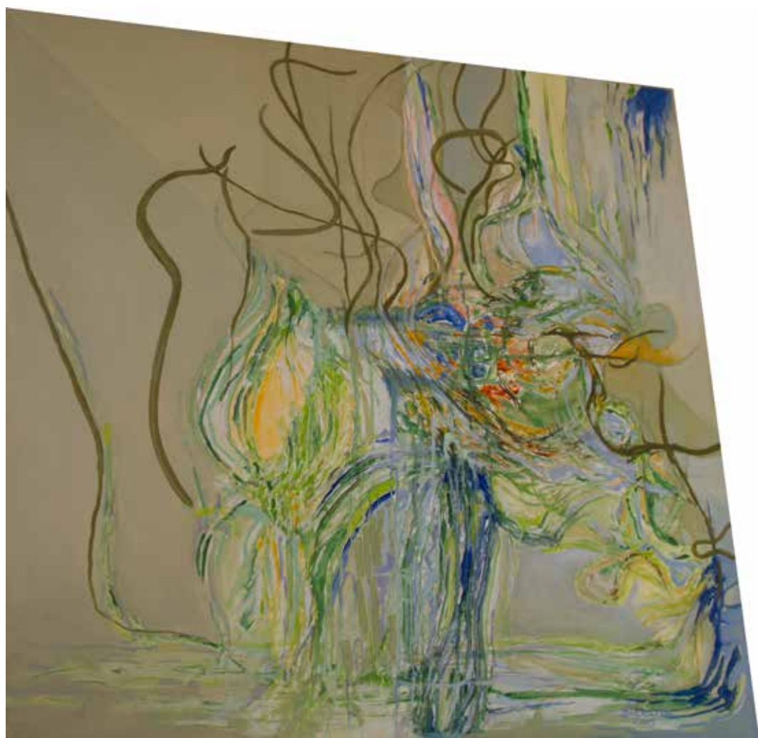
16. Escrita de água, 2015 Óleo s/ tela, 100x100 cm