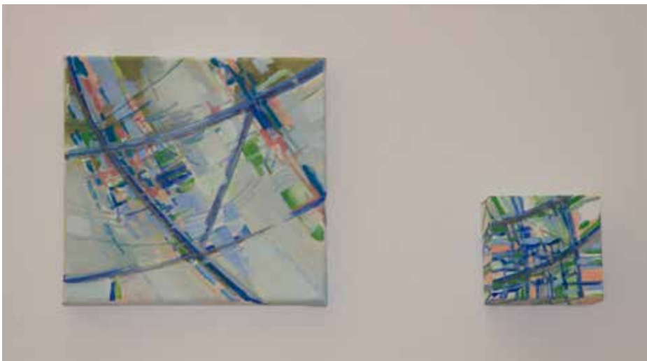
18/19. Composição II e III, 2015 Óleo s/ tela, 30x50 cm / cada