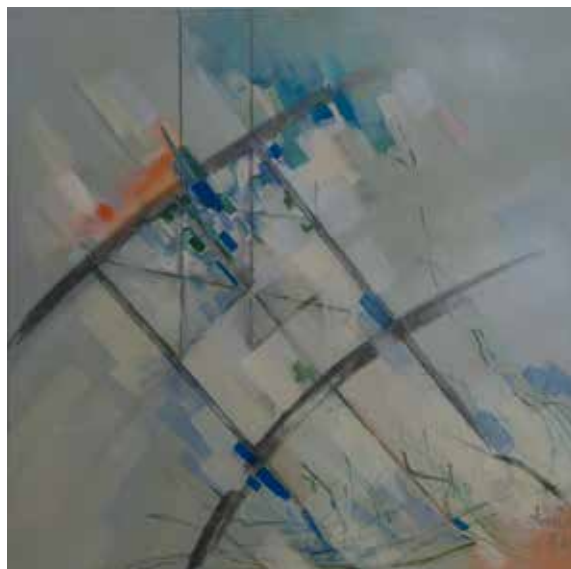
7/8. Arco de ponte I e II, 2013/14