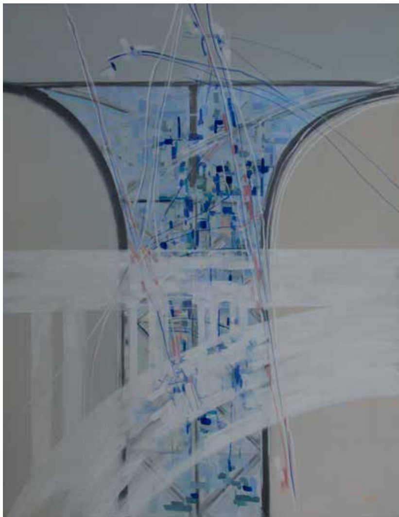
12. Cruzamento de arcos das pontes da Arrábida e Luiz I, 2012