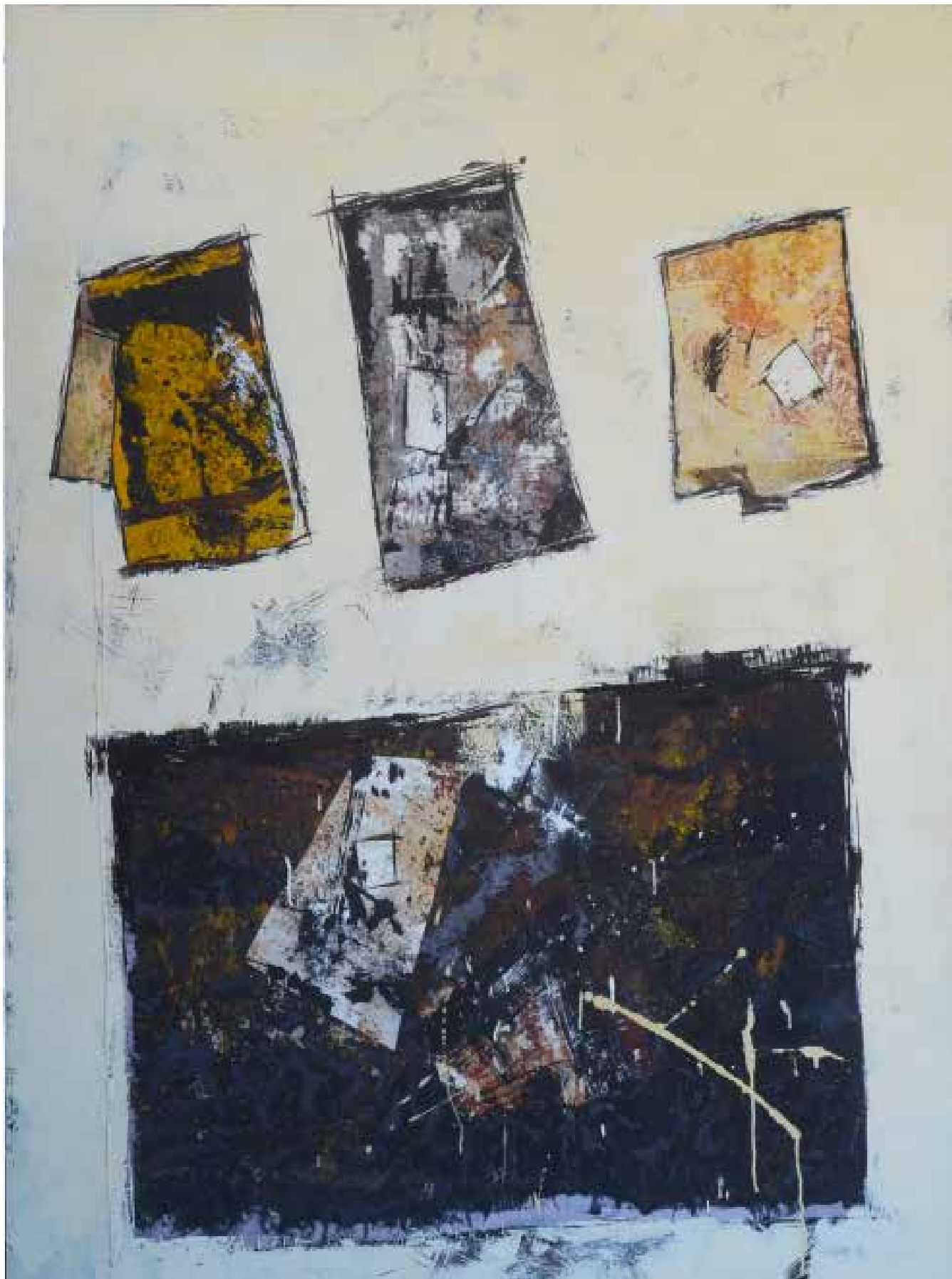
9- Sem título Técnica mista sobre tela, 150x123 cm