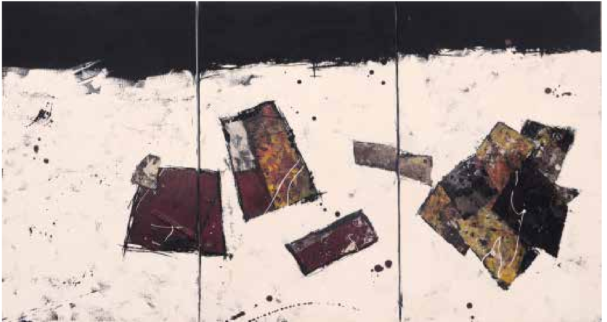
10- Sem título Técnica mista sobre tela, 80x150 cm