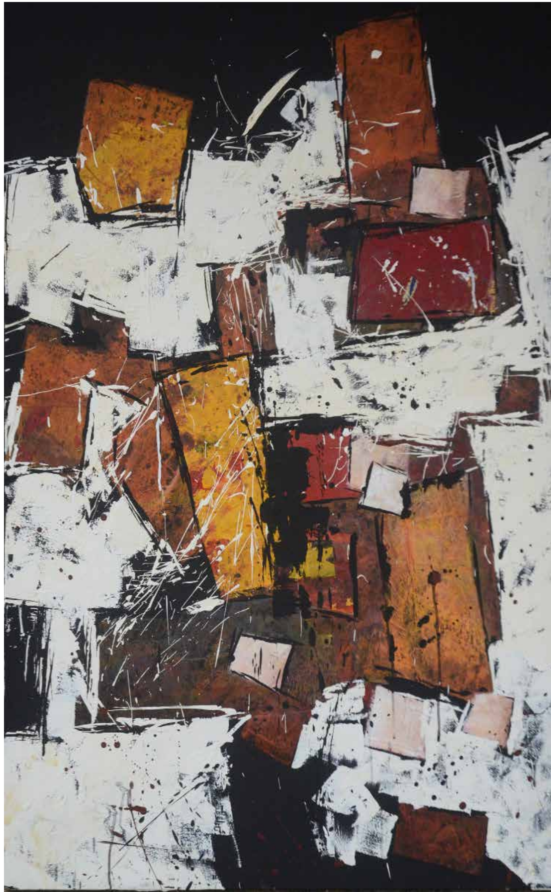
2- Sem título Técnica mista sobre tela, 132x89 cm