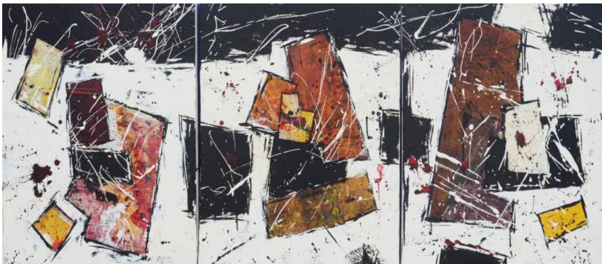
8- Sem título Técnica mista sobre tela, 60x150 cm