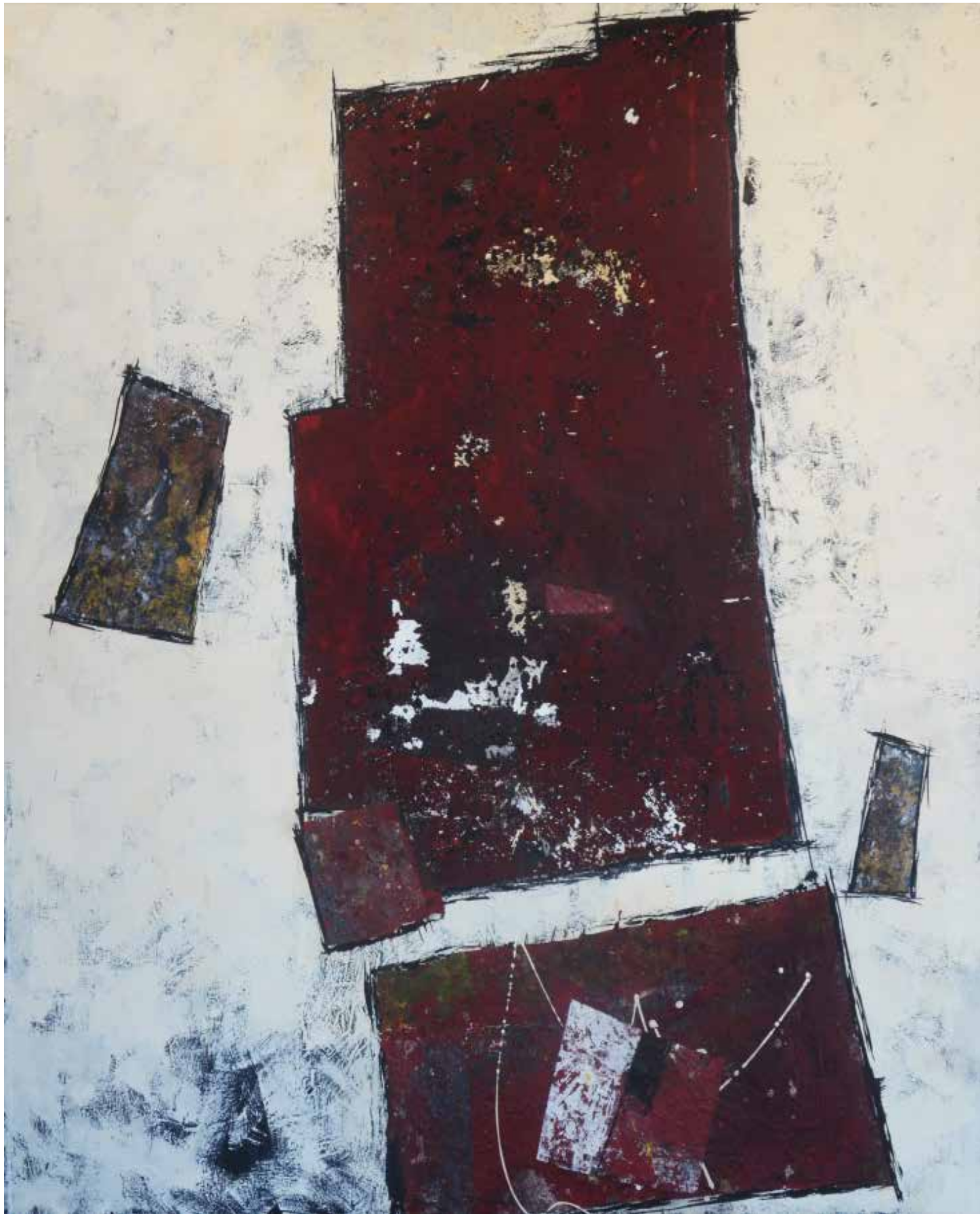
7- Sem título Técnica mista sobre tela, 154x134 cm