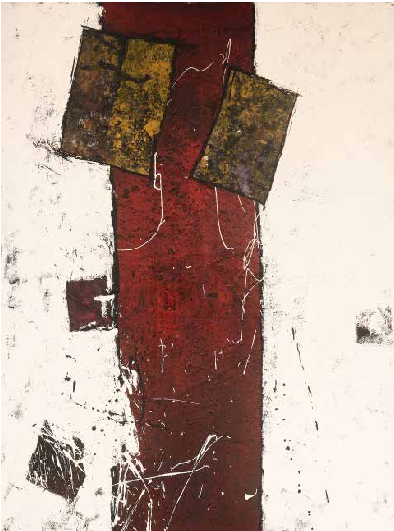
4- Sem título Técnica mista sobre tela, 135x115 cm