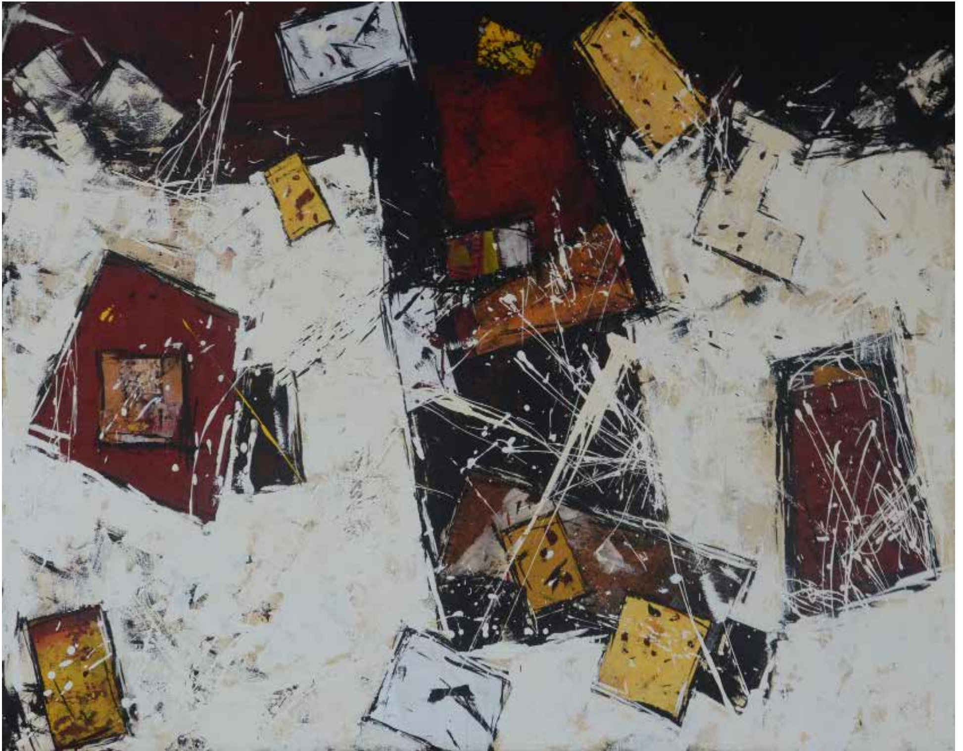
6- Sem título Técnica mista sobre tela, 110x150 cm