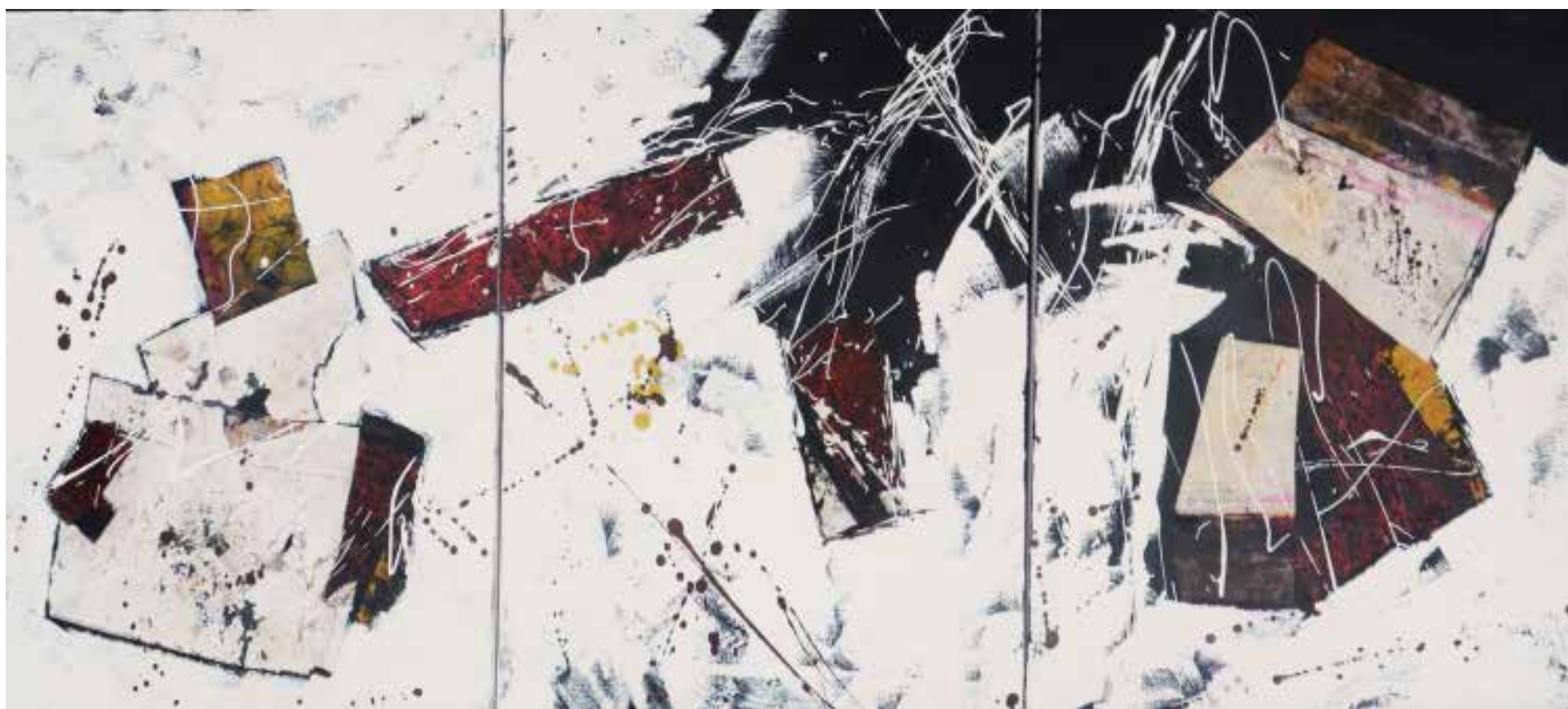
1- Sem título Técnica mista sobre tela, 60x150 cm