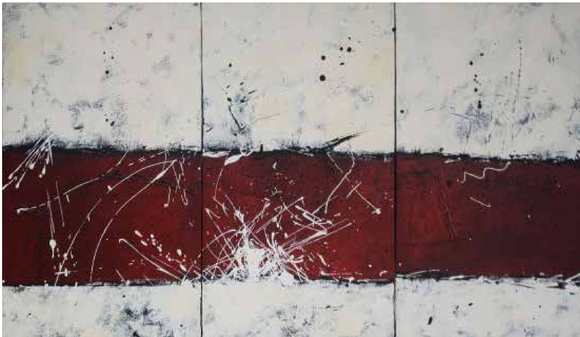
3- Sem título Técnica mista sobre tela, 80x150 cm