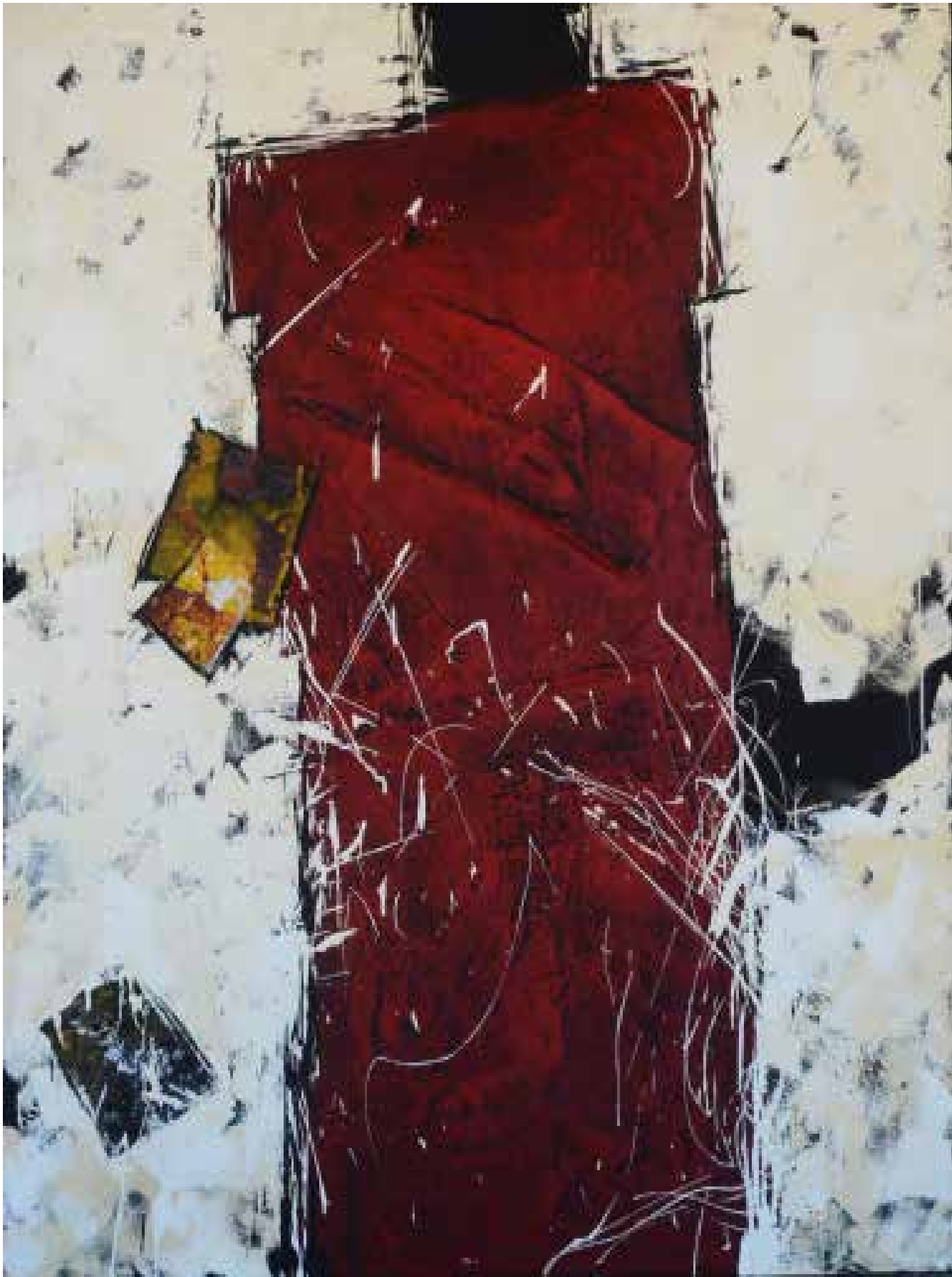
5- Sem título Técnica mista sobre tela, 152x123 cm