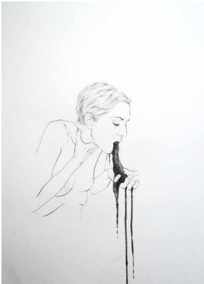
15. For I am falser than vows made in wine, 2013 Grafite e aguarela s/ papel, 70x50cm