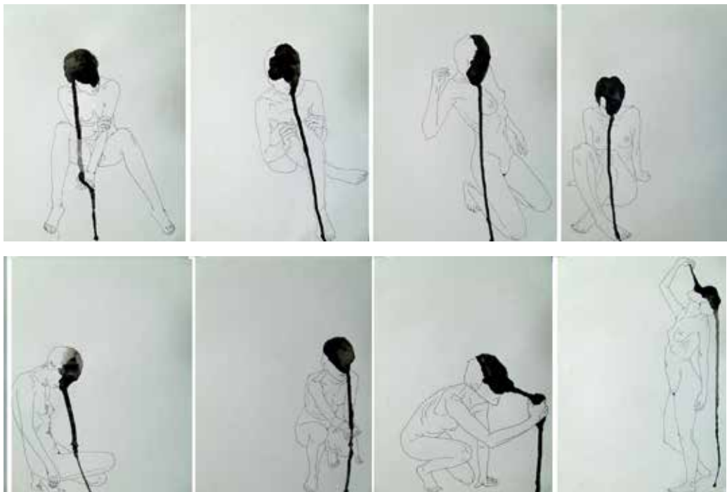
18. Each time you happen to me all over again, 2013 Caneta e tinta da china s/ papel, 29x172 cm