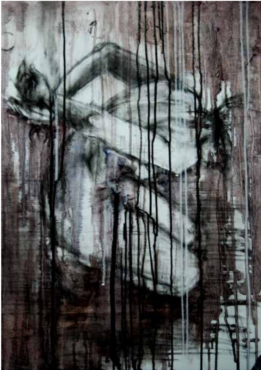
10. Mistress, you know yourself, down on your knees, 2014 Óleo, carvão e tinta da china s/ tela, 70x50 cm