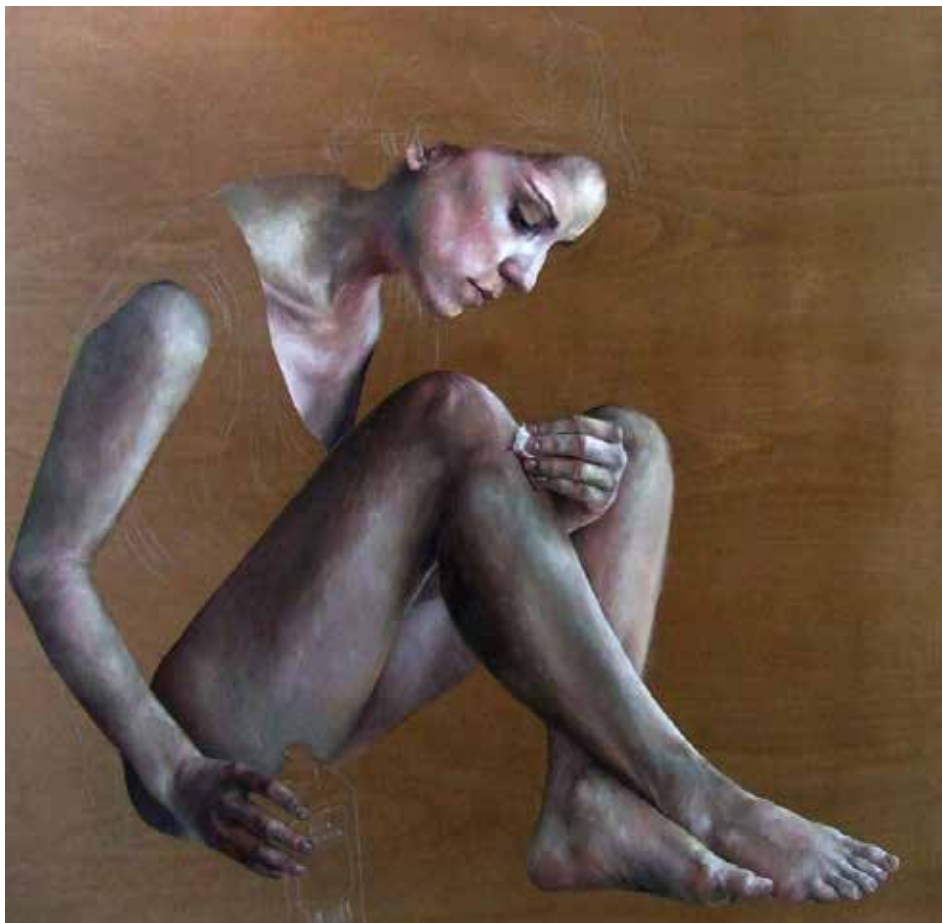
6. Self-healing material, 2013 Óleo s/ painel, 80x80 cm