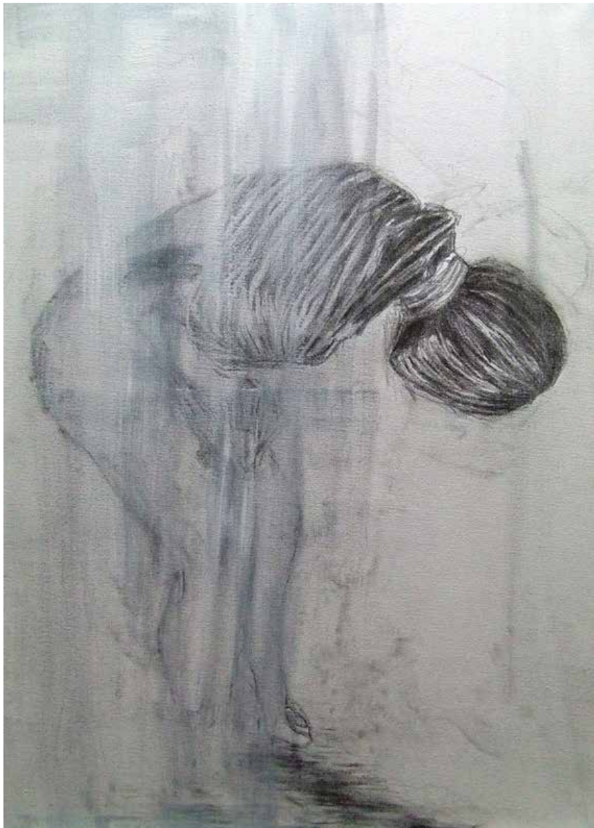
5. Believe me, my love, it was the nightingale, 2013 Grafite e acrílico s/ tela, 70x50 cm