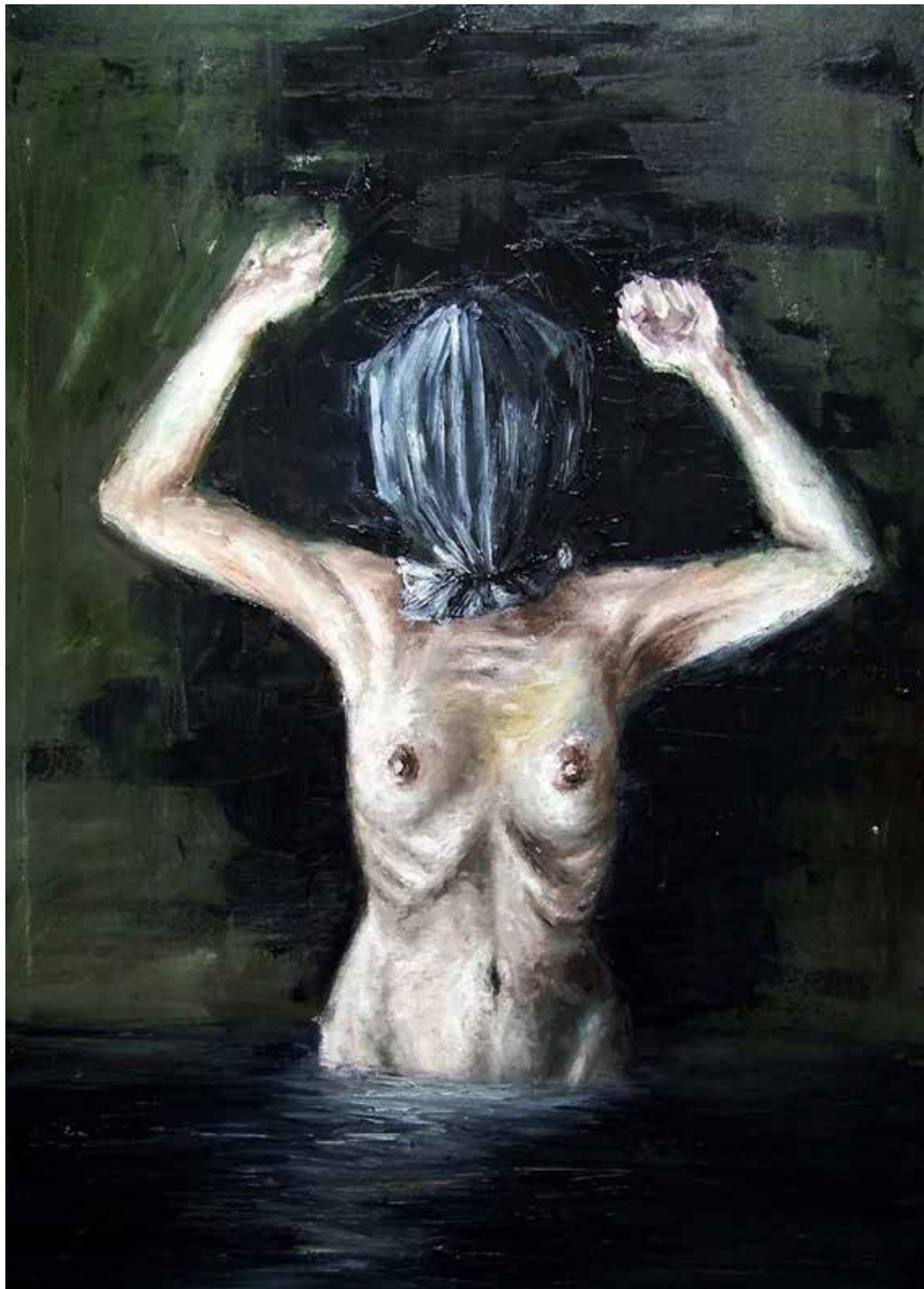
1. And therefore is winged Cupid painted blind, 2013 Óleo s/ tela, 70x50cm