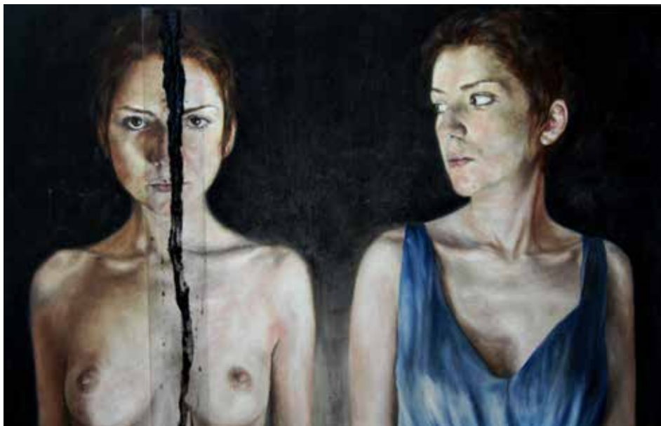
7. Stained Narcissus, 2012 Óleo s/ tela, 61x94 cm