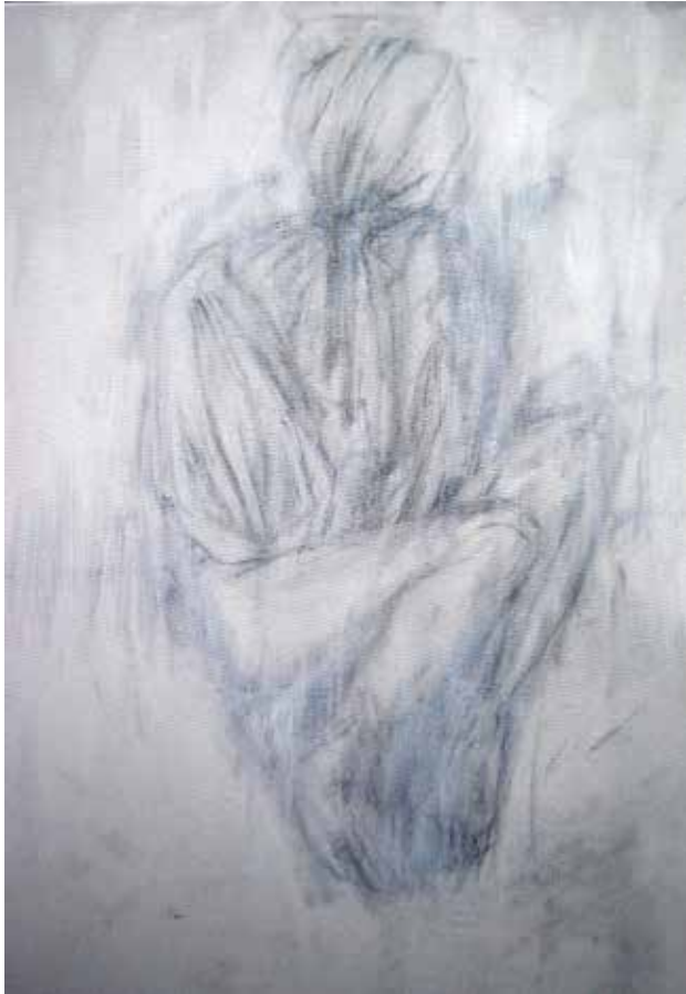
4. They have made worms' meat of me, 2013 Grafite e acrílico s/ tela, 48x39cm