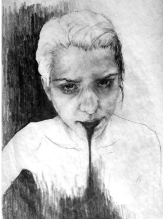
16. Who ever loved that loved not at first sight? , 2013 Grafite s/ papel, 21x20cm