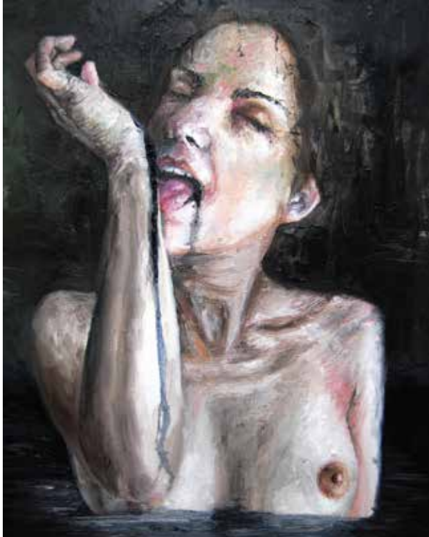
2. Do I Sink, 2013 Óleo s/ tela, 45x35 cm