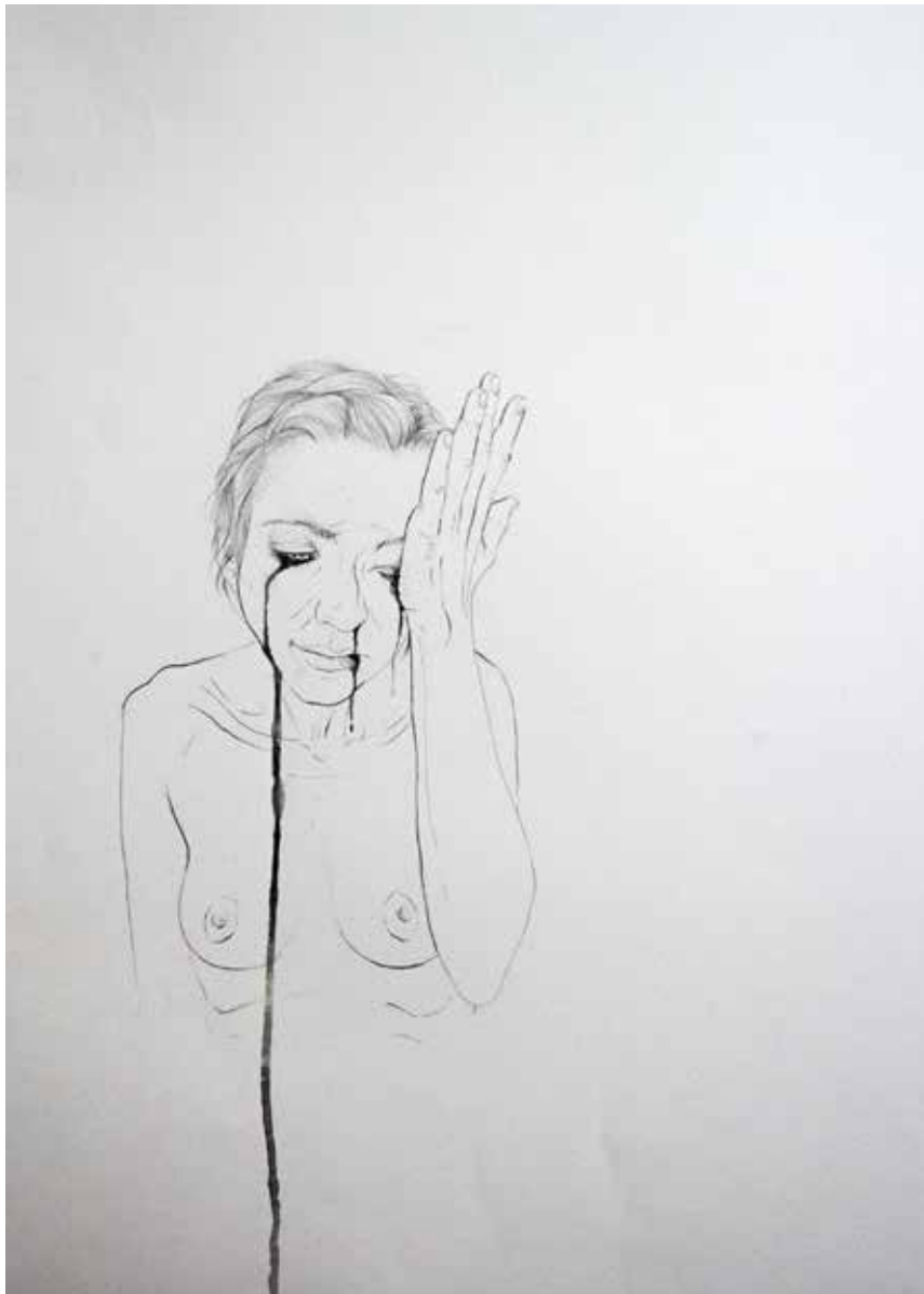
14. That I shall say good night till it be morrow, 2013 Grafite e aguarela s/ papel, 70x50cm