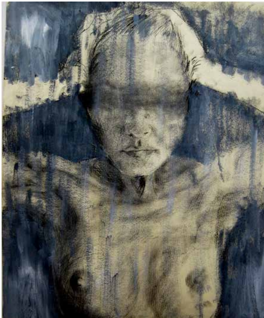
17. What is light, if Sylvia be not seen? What is joy if Sylvia be not by?, 2013 Carvão e acrílico s/ papel, 60x50 cm