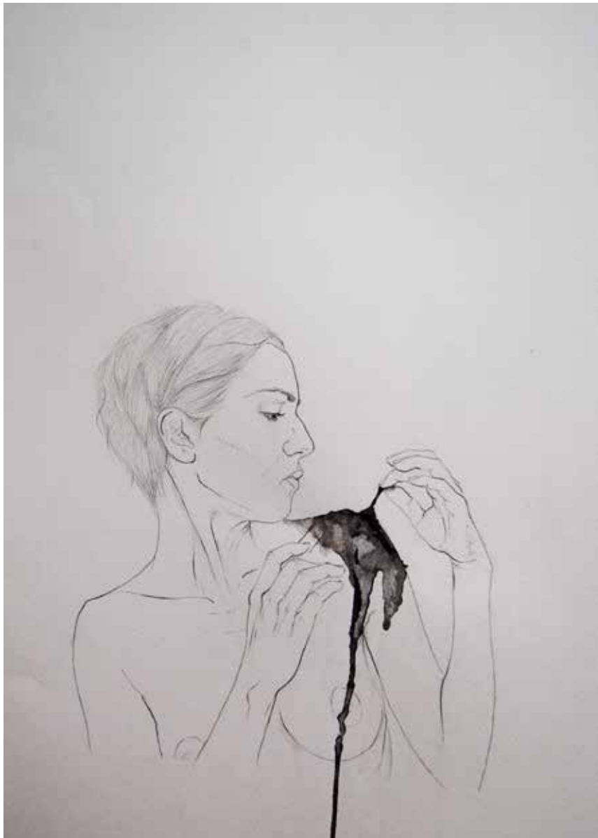
13. But love may transform me to an oyster, 2013 Grafite e aguarela s/ papel, 70x50cm