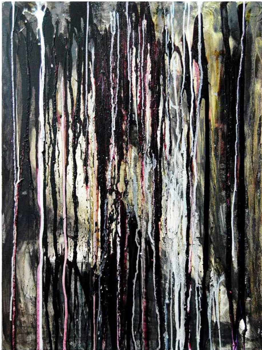
9. But I know what darkness is, it accumulates, thickens, then suddenly bursts and drowns everything, 2014