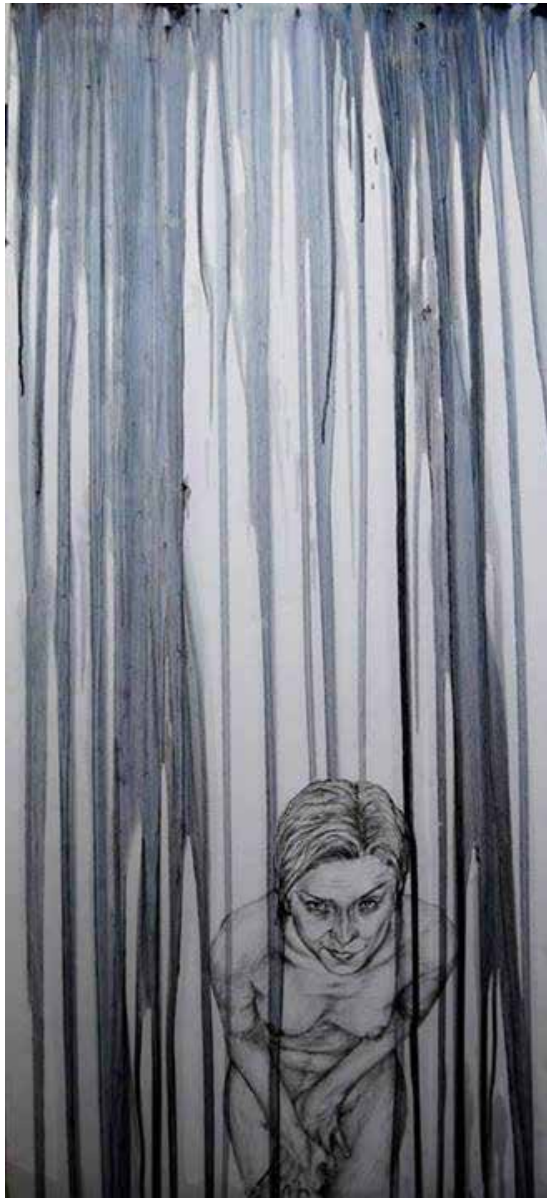
11. and you smiled because you knew, 2013 Grafite e acrílico s/ kapaline, 100x45cm